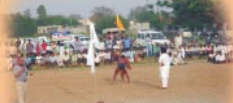
ਪਿੰਡ ਰਤਵਾੜਾ ਵਿਖੇ ਕੁਸ਼ਤੀ ਦੰਗਲ ਦ੍ਰਿਸ਼।