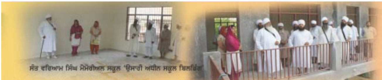
ਸੰਤ ਵਰਿਆਮ ਸਿੰਘ ਮੈਮੋਰੀਅਲ ਸਕੂਲ 'ਉਸਾਰੀ ਅਧੀਨ ਸਕੂਲ ਬਿਲਡਿੰਗ'

(ਸੰਤ) ਹਾਕਾ ਮਾਰਦੇ ਨੇ ਤੇ ਖੁਲਾ ਰਹੇ ਨੇ ਤੇ ਕਹਿੰਦੇ ਹਨ ਕਿ ਸਾਡੇ ਨਾਲ ਚਲ।" ਮੈਂ ਕਿਹਾ, "ਵੀਰ! ਤੂੰ ਕਹਿੰਦੇ ਕਿ ਮੈਂ ਨਹੀਂ ਜਾਣਾ।" ਮੈਂ ਕਿਹਾ, ਵੀਰ ਜੀ ਉਹ ਕਿੱਥੇ ਖੜ੍ਹੇ ਹਨ? ਤਾਂ ਉਸ ਨੇ ਕਿਹਾ, ਪੈਲੀਆ ਵਲ ਦੇ ਪਾਸੇ ਛੋਰੀਆਂ ਕੋਲ ਖੜ੍ਹੇ ਅਵਾਜ਼ ਮਾਰੀ ਜਾਂਦੇ ਨੇ। ਮੈਨੂੰ ਨਹੀਂ ਸੀ ਇਸਦੇ ਕੇਵਲ ਸੰਤ ਵੀਰ ਜੀ ਨੂੰ ਹੀ ਇਸਦੇ ਸੀ। ਸਿਰ ਚੁਕ ਕੇ ਕਹੀ ਜਾਵੇ, ਤੁਹਾਨੂੰ ਕਿਉਂ ਨਹੀਂ ਇਸਦੇ, ਮੈਨੂੰ ਤਾਂ ਇਸ ਰਹੇ ਨੇ।