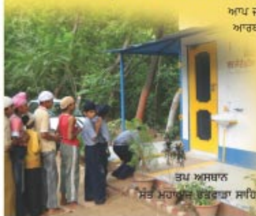
ਤਪ ਅਸਥਾਨ ਸੰਤ ਮਹਾਰਾਜ ਰਤਵਾੜਾ ਸਾਹਿਬ

30 ਅਕਤੂਬਰ ਸੰਨ 1978 ਵਿਚ ਆਪ ਜੀ ਤਰਾਈ ਛੱਡ ਕੇ ਚੰਡੀਗੜ੍ਹ ਆ ਗਏ ਅਤੇ ਆਪਣੇ ਰਹਿਬਰ ਦੇ ਹੁਕਮ ਅਨੁਸਾਰ ਪ੍ਰਚਾਰ ਦਾ ਕੰਮ ਅਰੰਭ ਕਰ ਦਿੱਤਾ। ਖੁਰੂ ਖੁਰੂ ਵਿਚ ਆਪ ਜੀ ਨੇ ਸੈਕਟਰ 34 ਵਿਚ ਕਿਰਾਏ ਦੇ ਘਰ ਵਿਚ ਨਿਵਾਸ ਕੀਤਾ ਅਤੇ ਪ੍ਰਚਾਰ ਲਈ ਇਕ ਮਿਸ਼ਨ ਦੀ ਸਥਾਪਨਾ ਕੀਤੀ ਜਿਸ ਦਾ ਨਾਮ ਵਿਸ਼ਵ ਗੁਰਮਤਿ ਰੂਹਾਨੀ ਮਿਸ਼ਨ ਰੱਖਿਆ। ਆਪ ਜੀ ਨੇ ਪ੍ਰਚਾਰ ਲਈ ਚੰਡੀਗੜ੍ਹ ਦੇ ਆਸ ਪਾਸ ਪਿੰਡਾਂ ਅਤੇ ਰੋਪੜ ਦੇ ਪਿੰਡਾਂ ਨੂੰ ਚੁਣਿਆ। ਇਹ ਪਿੰਡ ਆਪ ਜੀ ਲਈ ਨਵਾਂ ਨਹੀਂ ਸਨ, ਕਿਉਂਕਿ ਪੰਜਾਬ ਸਰਕਾਰ ਵਿਚ ਕੰਮ ਕਰਦਿਆਂ ਆਪ ਜੀ ਕਈ ਵਾਰੀ ਇਨ੍ਹਾਂ ਪਿੰਡਾਂ ਵਿਚ ਪ੍ਰਚਾਰ ਕਰਕੇ ਗਏ ਹੋਏ ਸੀ ਅਤੇ ਲੋਕ ਖਿਰਤੀਆਂ ਨੂੰ, ਉਨ੍ਹਾਂ ਦੀ ਰਹਿਣੀ ਬਹਿਣੀ ਅਤੇ ਚੱਜ ਆਚਾਰ ਤੋਂ ਜਾਣੂ ਸਨ। ਆਪ ਜੀ ਨੇ ਯੋਜਨਾ ਬੰਧ ਤਰੀਕੇ ਨਾਲ ਇਕ ਇਕ ਪਿੰਡ ਜਾਣਾ ਸ਼ੁਰੂ ਕੀਤਾ ਅਤੇ ਲੋਕਾਂ ਨੂੰ ਗੁਰੂ ਮਹਾਰਾਜ ਜੀ ਦੇ ਉਚੇ ਸੁੱਚੇ ਜੀਵਨ ਉਪਦੇਸ਼ਾਂ ਤੋਂ ਜਾਣੂ ਕਰਵਾਇਆ। ਹੌਲੀ-ਹੌਲੀ ਲੋਕ ਮਨਾਂ ਵਿਚ ਆਪ ਜੀ ਲਈ ਪਿਆਰ ਤੇ ਸਤਿਕਾਰ ਜਾਗਿਆ ਅਤੇ ਆਪ ਜੀ ਇਸ ਇਲਾਕੇ ਦੀ ਹਰਮਨ ਪਿਆਰੀ ਸ਼ਖ਼ਸੀਅਤ ਵਜੋਂ ਪਰਵਾਨ ਹੋਏ। ਹੌਲੀ ਹੌਲੀ ਹੋਰ ਲੋਕ ਵੀ ਆਪ ਦੇ ਮਿਸ਼ਨ ਨਾਲ ਜੁੜਦੇ ਗਏ ਤੇ ਮਿਸ਼ਨ ਦਾ ਕੰਮ ਤੇਜ਼ ਹੁੰਦਾ ਗਿਆ। ਇਹ ਦੀਵਾਨ ਵਧੇਰੇ ਕਰਕੇ ਰਾਤ 8 ਵਜੇ ਅਰੰਭ ਹੁੰਦੇ ਤੇ ਰਾਤ 11, 12 ਵਜੇ ਤੱਕ ਚਲਦੇ ਰਹਿੰਦੇ। ਇਸ ਪ੍ਰਚਾਰ ਦੌਰਾਨ ਆਪ ਜੀ ਨੂੰ ਅਨੇਕ ਮੁਸ਼ਕਲਾਂ ਵੀ ਆਉਂਦੀਆਂ, ਰਸਤੇ ਪੱਕੇ ਨਹੀਂ ਸਨ, ਉੱਚੇ ਨੀਵੇਂ ਰਸਤਿਆਂ ਤੇ ਲੰਘ ਕੇ ਜਾਣਾ ਪੈਂਦਾ ਸੀ, ਕਦੀ ਗਰਮੀ, ਕਦੀ ਸਰਦੀ, ਕਦੀ ਮੀਂਹ ਹਨੇਰੀ ਵੀ ਆ ਜਾਂਦੇ ਪਰ ਆਪ ਦ੍ਰਿੜ੍ਹ ਇਰਾਦੇ ਤੇ ਕਾਇਮ ਰਹਿ ਕੇ ਸਿੱਧੇ ਦੀਵਾਨਾਂ ਵਿਚ ਕਦੀ ਨਾਗਾ ਨਾ ਪਾਉਂਦੇ।